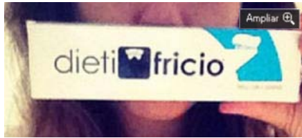
Dietifricio, la nueva pasta de dientes para adelgazar. | e.p.

e.p. El último boom para adelgazar es la invención de una nueva pasta de dientes llamada Dietifricio, que según su creador, tiene un efecto real.